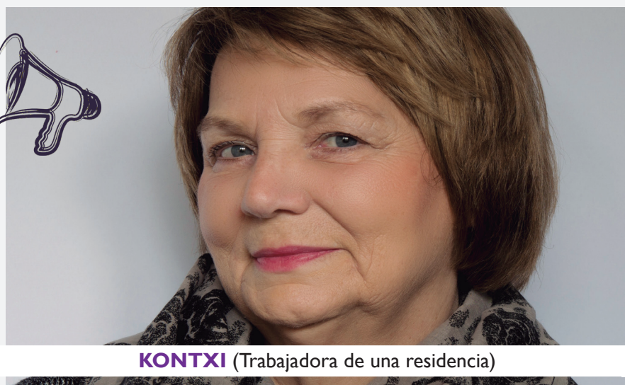
KONTXI (Trabajadora de una residencia)